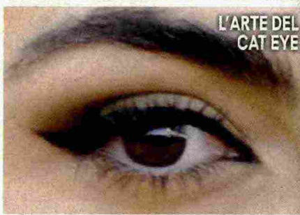
L'ARTE DEL CAT EYE

Una vera passione per il beauty e per il makeup porta a esibire look sempre ricercati. A parlare di seduzione e di fascino è lo sguardo che spicca su un volto dai tratti scolpiti. Tecnica e precisione anche per le labbra